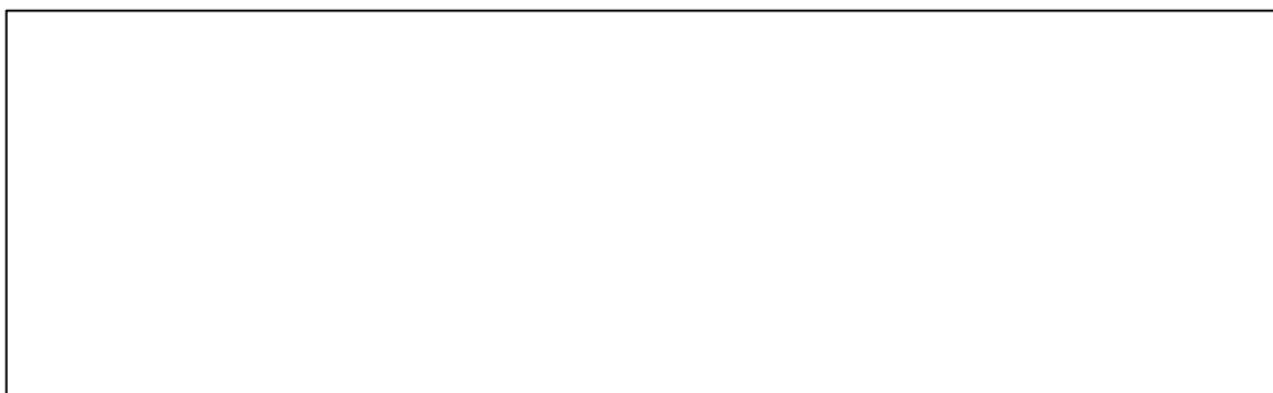
図 1 表題 (見出し)